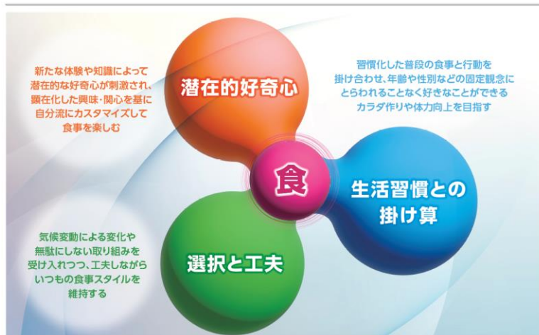
NISSHIN oillio 2025年 生活者の食生活に関する消費マインド予測 “植物のチカラ”

「生活者の消費マインド予測 2025」の詳細: https://www.nisshin-oillio.com/report/top/pdf/2025.pdf