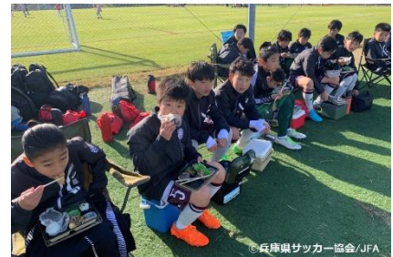
2024年都道府県大会の様子