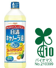
左:対象商品例 右:バイオマスプラスチックマーク ※商品画像は こちら からダウンロードいただけます。

2021年度に導入した600g、400gペットボトルの再生PET樹脂に加え、環境対応素材の活用範囲を拡大してまいります。