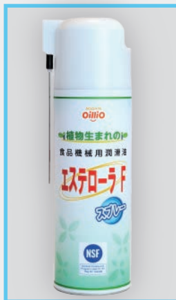
エステローラFスプレー